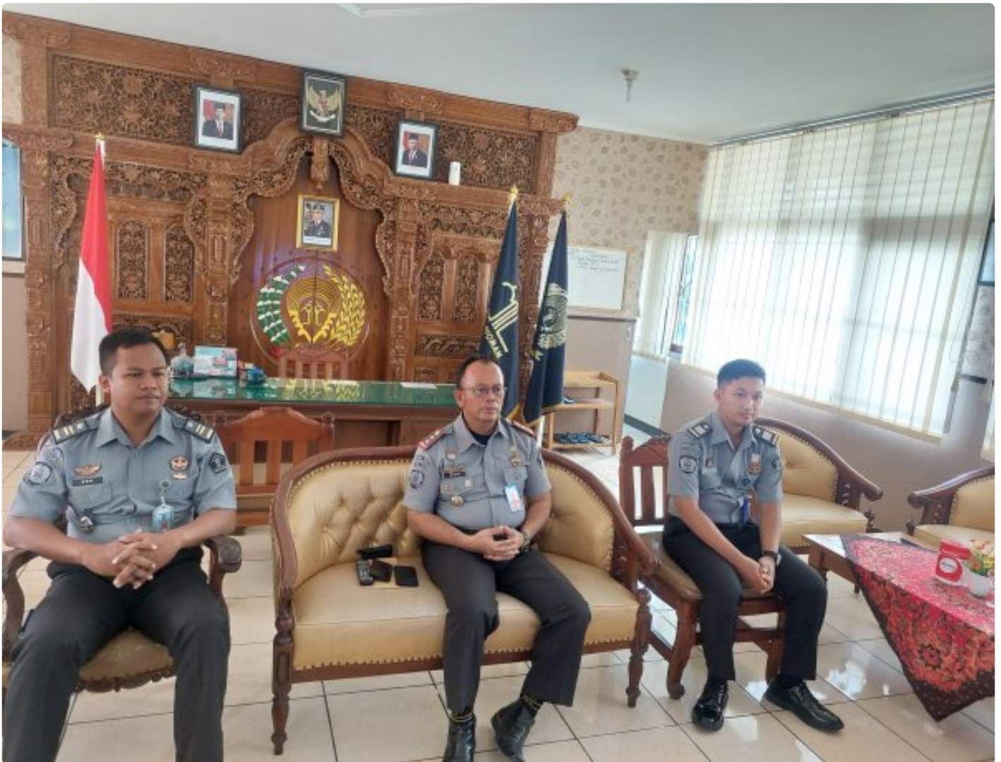
Blora - Rutan Kelas IIB Blora Kanwil Kementerian Hukum dan HAM Jawa Tengah